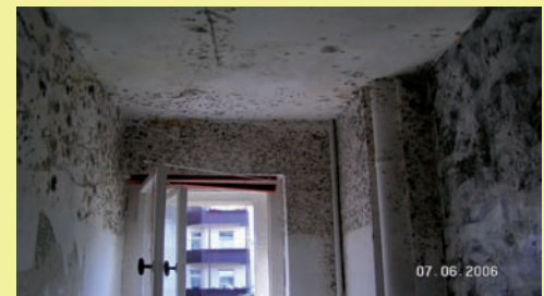
Verschimmelte Wohnung vor der Sanierung