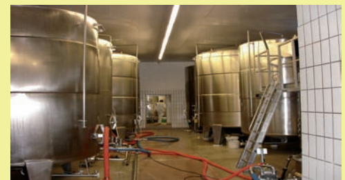
Industrieobjekt vor der Sanierung mit BioRid